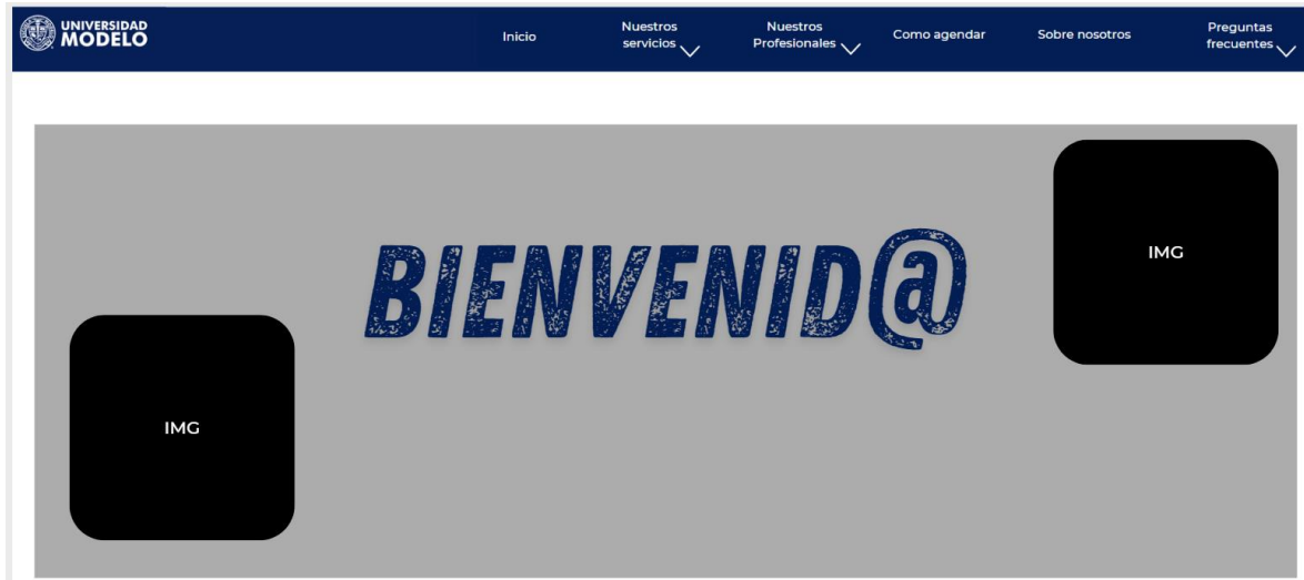
Figura1. Pagina de inicio