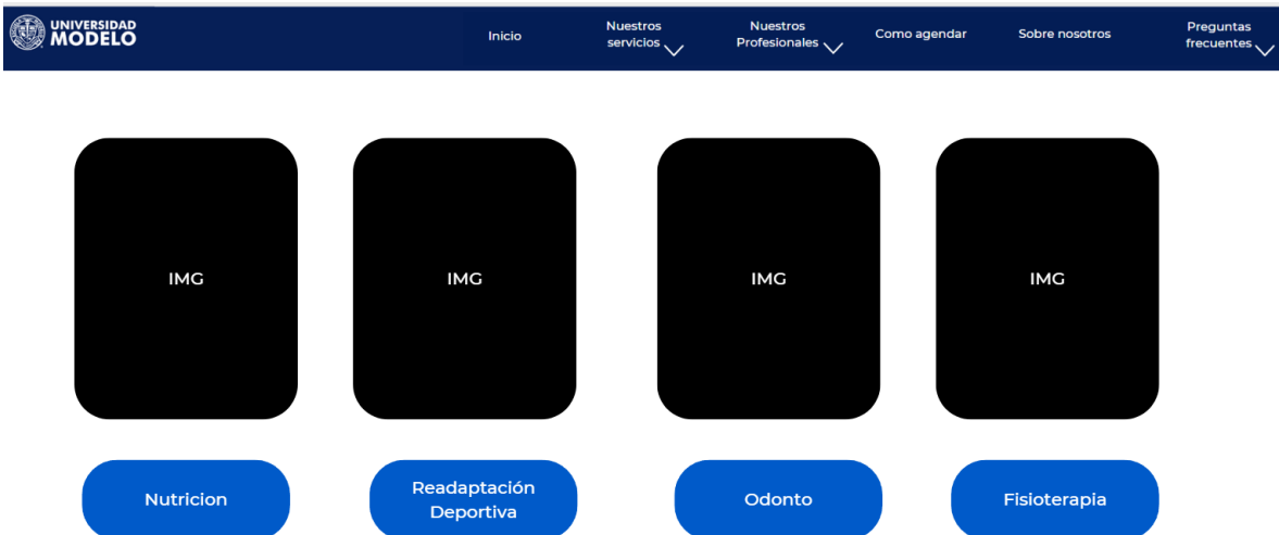
Figura4. Página " Como agendar"