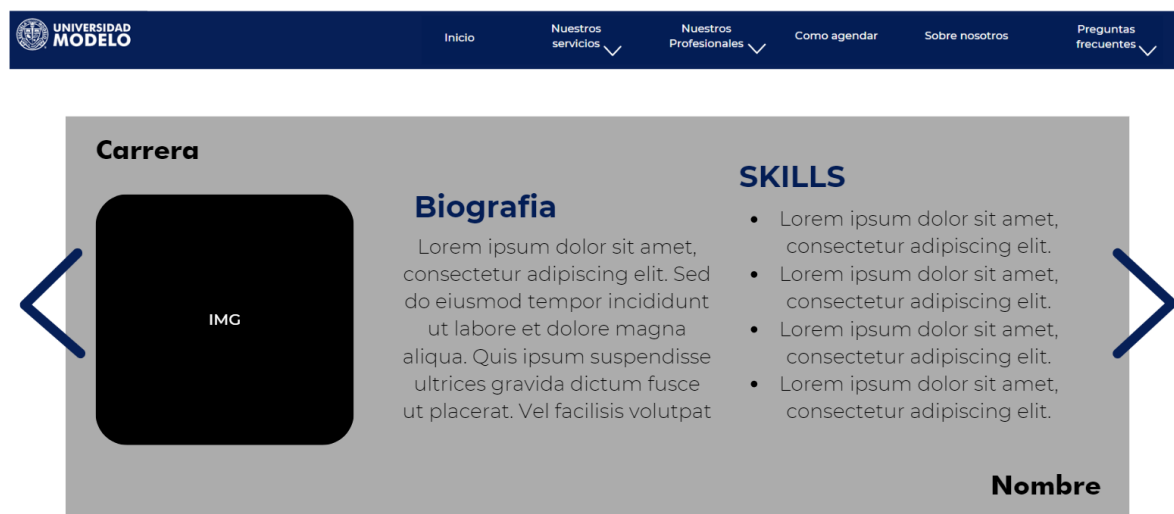
Figura2. Página "Nuestros profesionales"