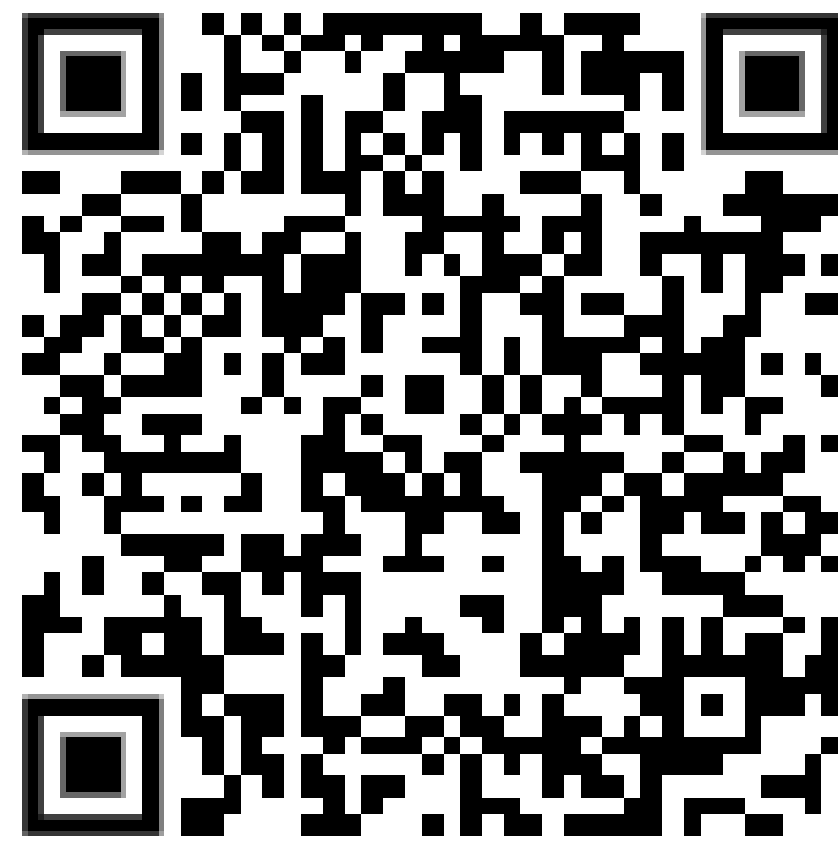
Figura 2: Encuesta a usuarios.