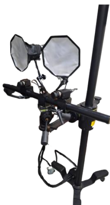
Imagen 1. Equipo de correlación digital de imágenes “GOM ARAMIS 5M LT” [2]

En la unidad de materiales del Centro de Investigación Científica de Yucatán (CICY) se realizan diversas pruebas para evaluar las deformaciones mecánicas en materiales compuestos, principalmente polímeros reforzados con nanotubos de carbono, hojas grafénicas y otros materiales avanzados. Para estos análisis, se emplea una máquina especializada (Imagen 1) que mide las deformaciones mecánicas mediante la técnica de Correlación Digital de Imágenes (DIC, por sus siglas en inglés) . Este método consiste en la captura de múltiples imágenes de un mismo punto del material sometido a pruebas de deformación, como tracción, compresión o flexión, permitiendo así determinar la deformación a partir del desplazamiento de los píxeles en las imágenes capturadas [1].