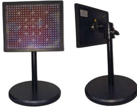
Imagen 2. Base de calibración actual.

Para optimizar este proceso, se propone el desarrollo de una nueva base de calibración (Imagen 3) que incorpore un sistema mecatrónico con motores a pasos, permitiendo ajustes de alta precisión. Además, contará con una botonera para facilitar la navegación entre los diferentes pasos del proceso y una pantalla LCD que brindará información en tiempo real sobre el estado de la calibración. Con esta mejora, se espera que el proceso de calibración sea más rápido, eficiente y preciso, permitiendo que el equipo pueda ser calibrado correctamente en el primer intento, reduciendo el margen de error y mejorando la reproducibilidad de las pruebas.